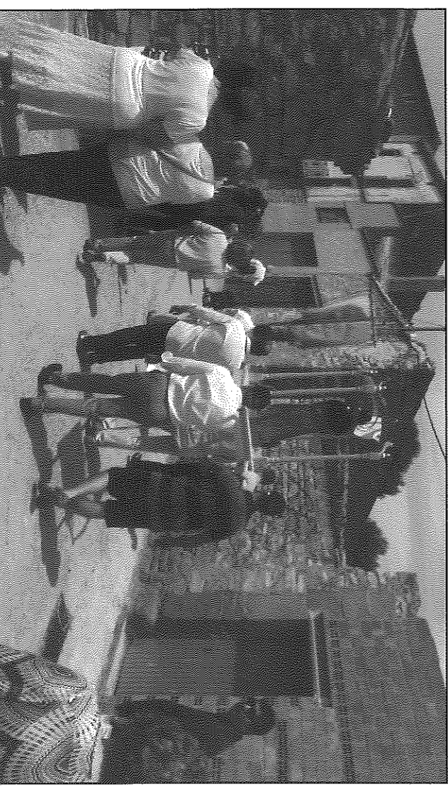
Els veïns van tornar a treure en processó la imatge del patró del poble

panera. L'associació de veïns, que valora molt positivament els actes i la participació, ha volgut agrair a tothom que s'ha implicat en l'esdeveniment, la seva presència. A Belveié seguiran les festes majors de Granollers de Segarra, aquest dissabte 27 per la tarda, amb una caminada per la Vall del Llobregós, missa i ball, i la de Ribera, durant tot el cap de setmana, amb sopar de germanor, ball, missa i vermut.