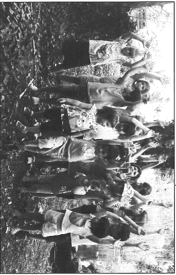
Alguns dels nens i nenes del municipi que estan participant en el Casal de Sedó

a la piscina, entre altres. Com a curiositat, cal destacar que aquesta setmana han preparat un àpat amb la cuina solar que el centre ha adquirit aquest mateix estiu.