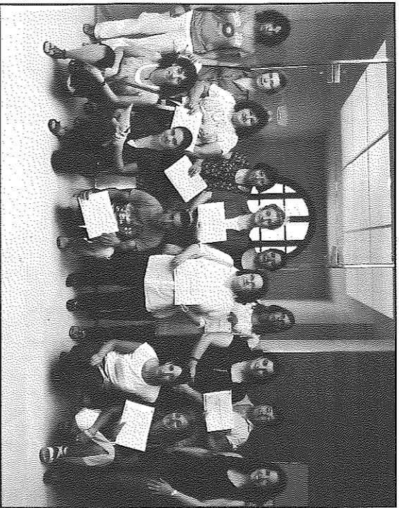
Els participants en el curs van rebre un diploma acreditatiu

Les tres diferents formacions es coordinen des de l'àrea de Promoció Econòmica del Consell Comarcal de la Segarra.