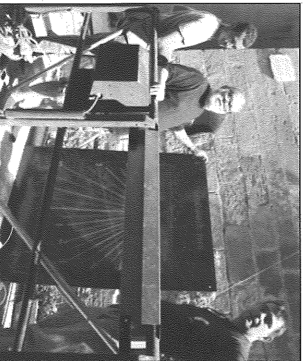
El peculiar rellotge solar, abans de ser elevat fins a la seva definitiva ubicació

GUSSONA.- El passat divendres va tenir lloc a les piscines municipals de Guissona la cloenda del primer torn dels cursos de natació, que ha comptat amb tres monitors i una cinquantena de participants, els quals s'han seguit durant tres setmanes, amb una hora diària de diluns a divendres, en grups reduïts d'una mitjana de cinc alumnes. Cal dir que, un cop acabat el primer torn, aquest diluns ja ha començat el segon, que acabarà el proper 9 d'agost.