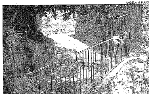
Els carrers de Biosca, guarnits amb plàstic reciclat.