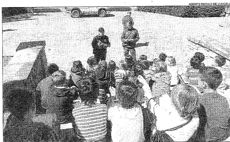
El Cos d'Agents Rurals de l'Urgell, durant les xarrades de divulgació ambiental a les escoles.