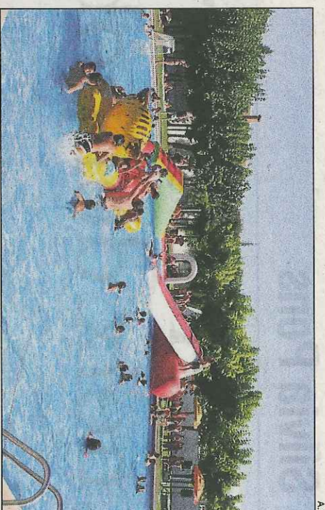
Festa aquàtica a les piscines municipals de Bellpuig.