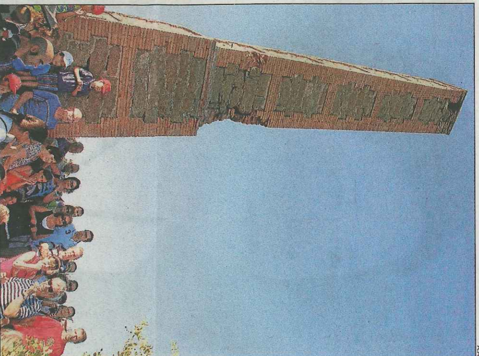
Els participants, en el monòlit de Montclar durant la visita guiada.

Segons l'alcalde d'Agramunt, Bernat Solé, "es tracta d'una iniciativa que té per objectiu apropar els diferents pobles que conformen el municipi d'Agramunt i donar a conèixer els valors patrimonials de cadascun dels pobles mitjançant visites guiades".