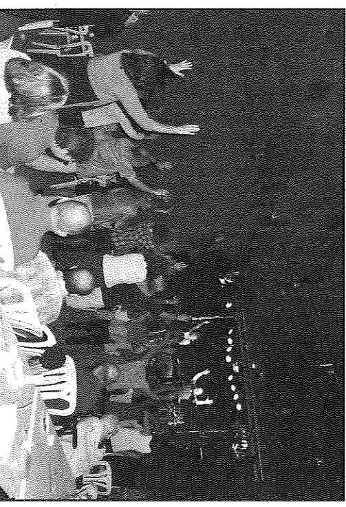
Els veïns van participar activament en la festa

carrer per celebrar amb bon humor una nova edició d'aquesta festa.