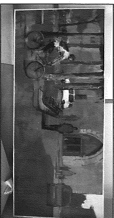
El quadre guanyador del concurs de pintura ràpida d'enguany

A més, el Six Bar va convidar a esmorzar a tots els artistes participants en el concurs.