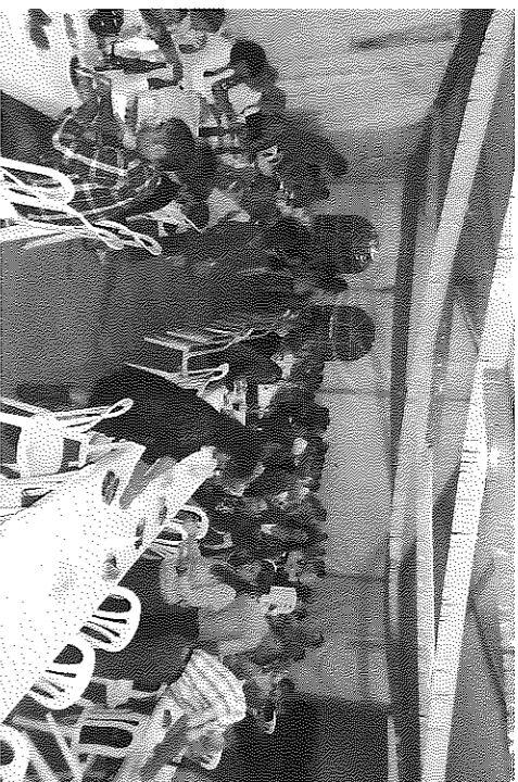
Una carpa va acollir el sopar que va aplegar tots els veïns del municipi.

festat que aquesta jornada és "fruit de la col·laboració de les entitats de Torrefeta i Florejacs, a les quals s'ha d'agrair la il·lusió, l'esforç i la dedicació amb la que han