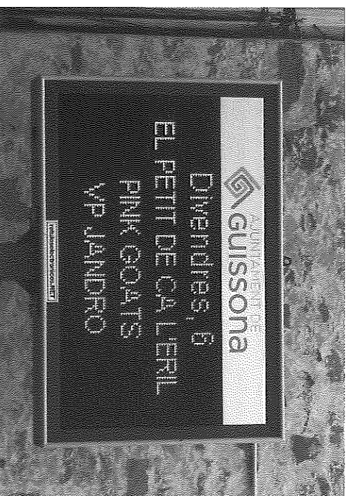
Des d'aquesta setmana, la pantalla gegant es troba ja en funcionament

i altres aspectes d'agenda de la vila. A més, aquesta pantalla oferirà missatges publicitaris dels comerços i empreses de la vila o bé de l'entorn, mitjançant els quals està previst finançar totalment el lloguer que es paga per la pantalla.