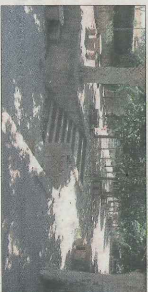
AJUNTAMENT DE GUISSONA

L'adequació d'aquesta via té un cost de 29.997 euros dels quals el 75% estan subvencionats pel Departament de Medi Ambient. El disseny de la via verda ha comptat amb el suport del Centre Excursionista Guissonenc, el qual ha prioritzat l'arranjament del recorregut, deixant com a secundària la senyalització.