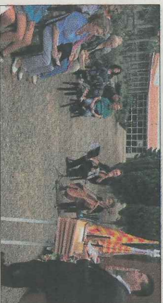
PAERNA DE CERVERA