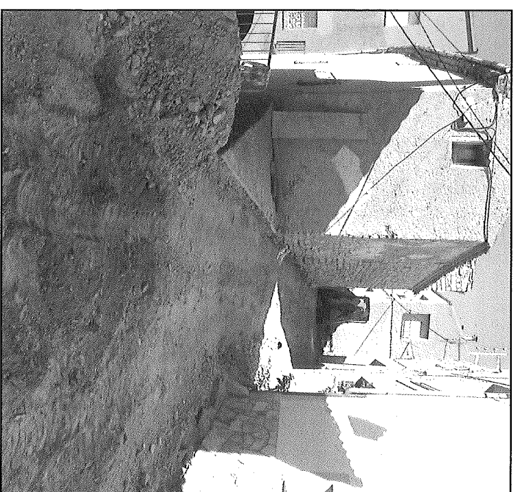
Estat actual dels treballs, iniciats a principis d'aquest setembre

La nova botiga on-line ha estat completament renovada, tant a nivell de disseny, continguts i especialment en la seva usabilitat, per simplificar i agilitar al màxim tot el procés de compra. També en la modalitat de lliurament a domicili hi ha noves franges horàries. Destacar que tot el procés de preparació de comandes, la logística, així com l'equip tècnic i d'atenció al client és intern.