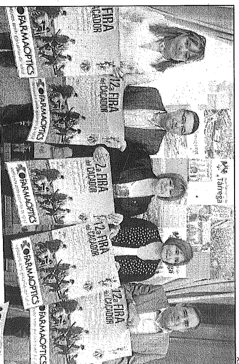
Dilluns es va presentar la fira als mitjans de comunicació.