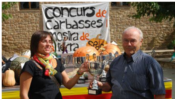
Un moment de l'entrega de premis.