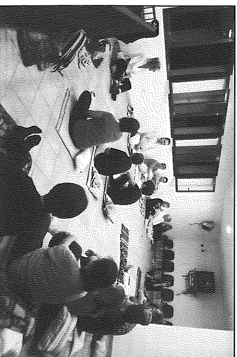
Les sessions s'allargaran durant tot el curs escolar

TORREFETA.- El passat divendres, Torrefeta va acollir la primera sessió de les sessions de ioga i meditació que, durant nou mesos, es realitzaran al local social del poble. Vingudes de tot el municipi, comarca i demarcació de Lleida, una trentena de persones