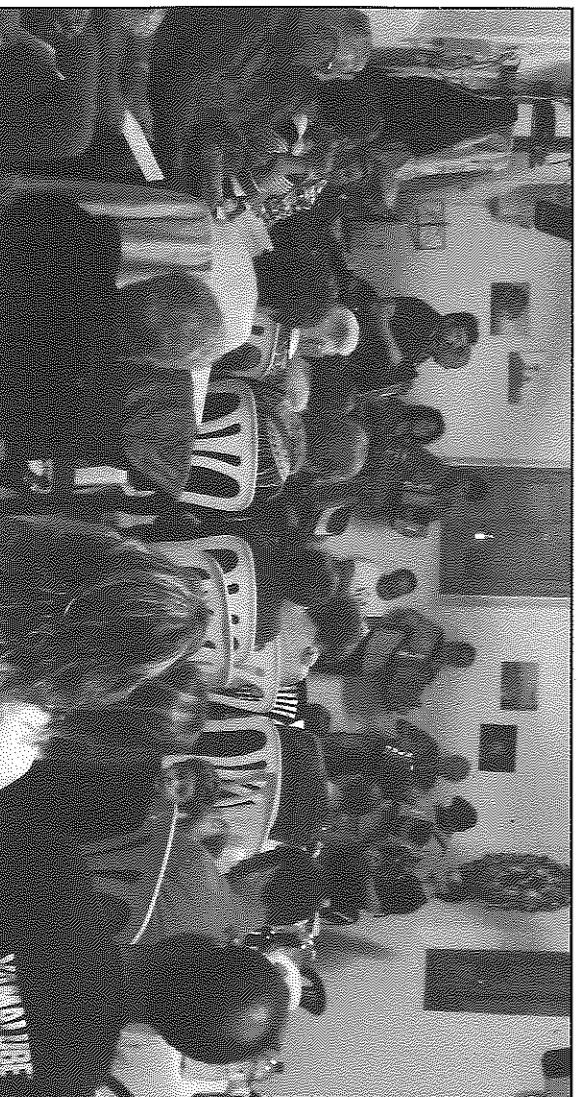
Imatge de l'actuació dels acordionistes, al local social de Palou

organitzada per l'Associació de Veïns de Palou, que recollia l'alegria de primera hora de la tarda, quan en l'enfrontament del Club de Billies Palou amb el Cabana bona, els primers van iniciar la lliga amb una important i motivadora victòria.