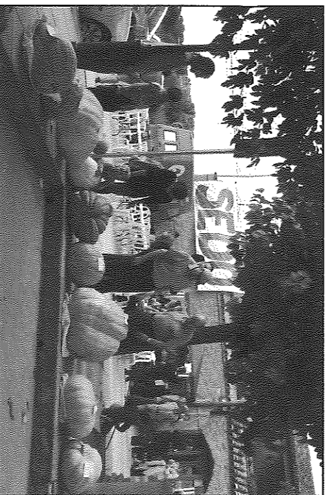
Nombrosos exemplars van competir en el certamen

El ja consolidat concurs va estar acompanyat d'una nova mostra de la terra, amb unes quaranta parades de productes de proximitat, la degustació de productes elaborats amb carabassa, a