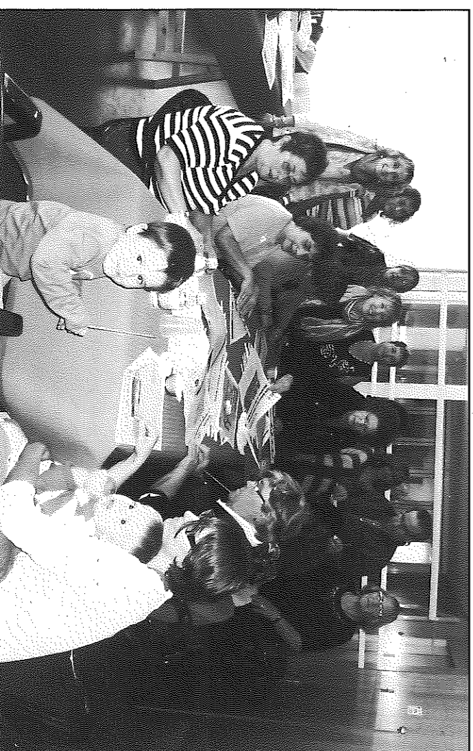
Imatge de grup dels participants en la primera de les sessions d'aquest nou curs a Sant Guim