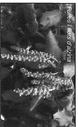
Fulles i fons d'alzina