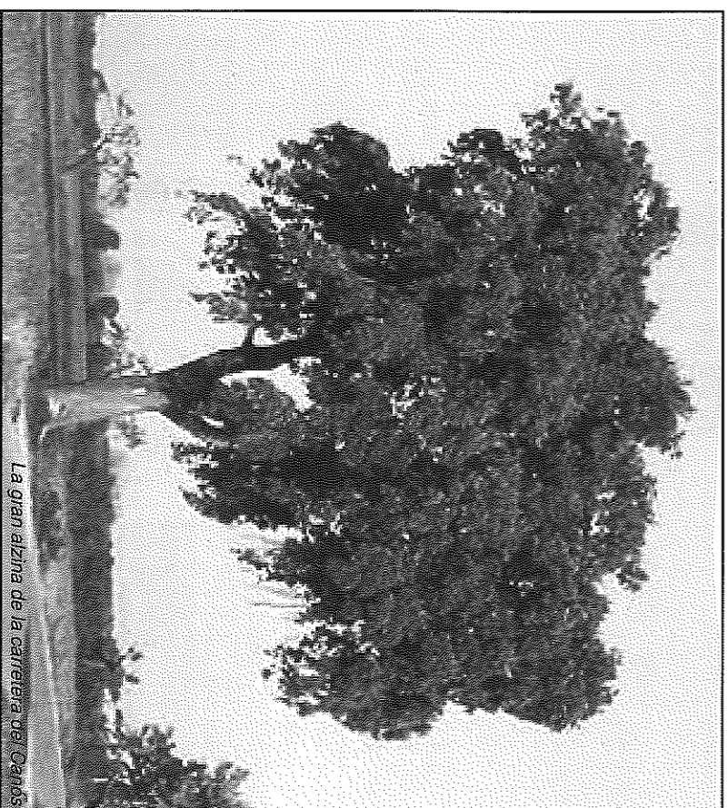
La gran alzina de la carretera del Canós