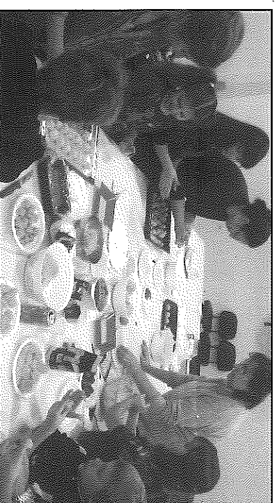
Alguns dels voluntaris que van elaborar els panellets

dony i, com no pot ser d'una altra manera, de pinyons. Fets les formes, es van enfortir a diferents cases i es van menjar en el sopar de germanor del dissabte, 2 de novembre, juntament amb castanyes i tot ben regat per moscatell.