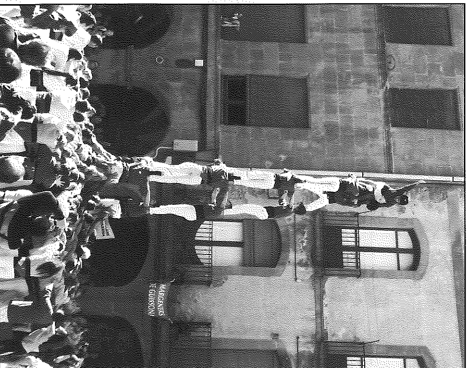
El 3d7 aixecat per sota dels Margeners de Guissona

A la segona ronda, els Margeners mostren un cop més el maravellos potencial que té a la pinya, i la seguretat en una estructura com és el tres, per així poder-lo fer aixecat per sota. És el segon tres de set per sota d'aquesta temporada, sent un dels millors castells portat a moltes plaçes altres anys, i que segur seguiran portant. Els de Solsona descarreguen un quatre