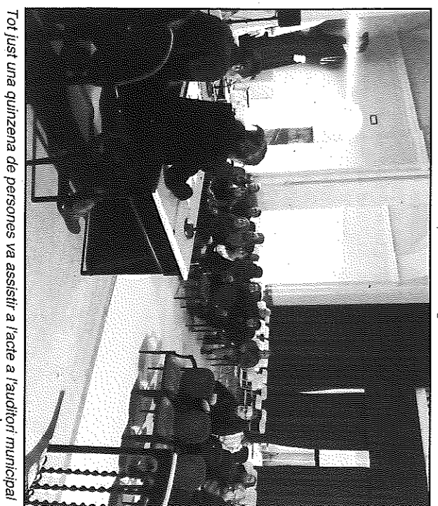
Tot just una quinzena de persones va assistir a l'acte a l'auditori municipal