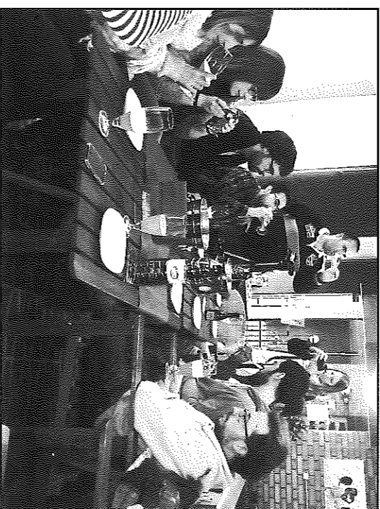
El grup de bloggers al Celler de Guissona

L'activitat va partir de la iniciativa del restaurant el Celler de Guissona, que amb la voluntat de potenciar el turisme actiu de la plana de Guissona i donar-lo a conèixer a través de les xarxes socials, va convocar l'esdeveniment, que es va poder seguir a la xarxa a través de l'etiqueta #bcntBbloggers.