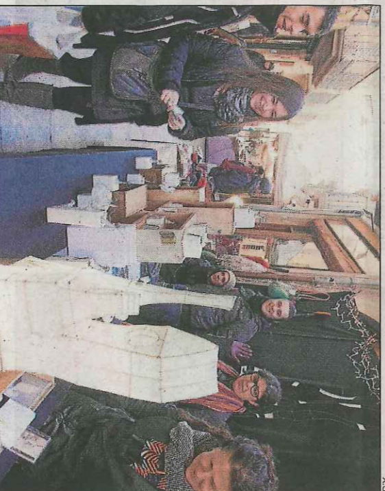
El pas dels gegants pel carrer Major.