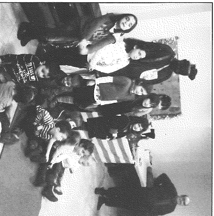
Els més petits van donar les cartes al patge a Torrefeta

Al seu torn, al restaurant La Redoita de Florejacs es van ajuntar una vintena de persones del poble que van celebrar haver guanyat el premi del concurs municipal de passebres d'enguany, mentre compartien una fàrcida taula amb els elements típics del Nadal.