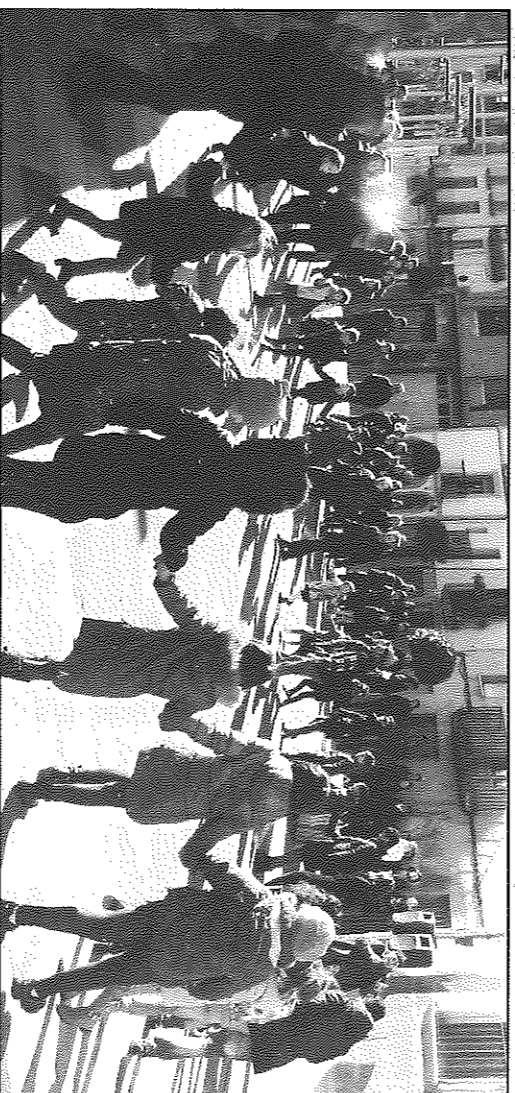
Els nens i nenes de Torà van fer cagar el tío a la plaça del Vall