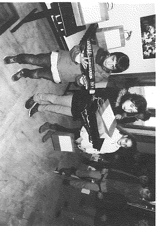
Els joves fotogràfs guardonats van recollir els seus premis

SANT GUIM DE FREIXENET. - El passat diumenge 22, a migdia, va tenir lloc l'acte d'entrega de Premis del 1er Concurs de Fotografia Escolar, organitzat per l'Agrobotiga/Centre d'Interpretació Sikarra Nosta. El concurs comptava amb la col·laboració de l'Ajuntament de Sant Guim i el CEIP L'Estel, per als alumnes del qual anava dirigit, amb l'objectiu de posar en valor i promocionar els arbres propis de la Segarra i en especial els habituals pins de Sant Guim de Freixenet. Pel que fa als guanyadors del