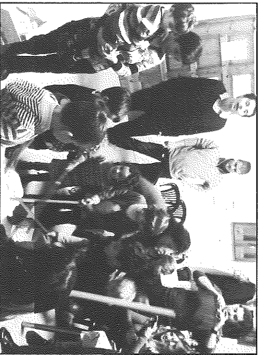
Els nens i nenes de Palou van fer cagar plegats el tío

cagar el tío, s'ho van passar d'alto més bé cantant i donant garrotades a un tronc de Nadal que va ser generós en regals per als més menuts. La nit va acabar amb tot el veïnatge