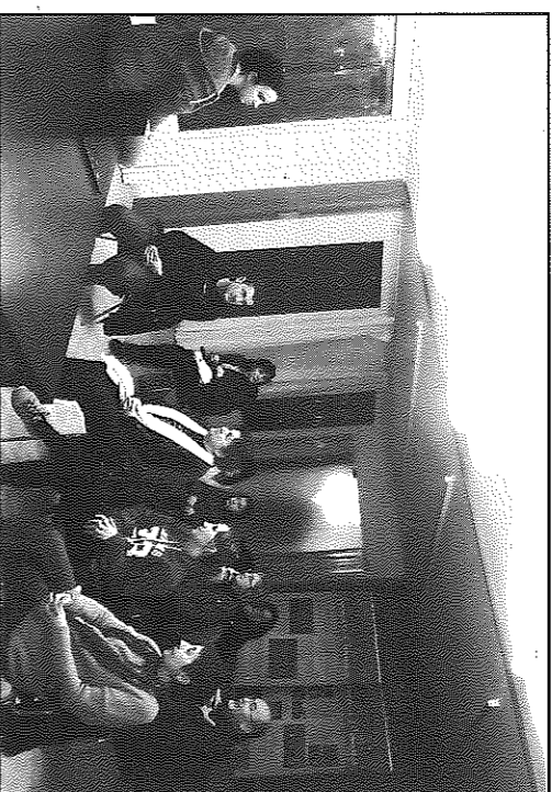
El curs es duu a terme a les dependències municipals a Torrefeta

que poden triar els mateixos alumnes. Al curs hi ha homes i dones de totes les edats i, com que està obert a tothom que tingui ganes de cantar, es preveu que el grup creixi a mesura que passin les setmanes. Aquesta iniciativa se suma a d'altres, com la de ioga i meditació, que s'estan duent a terme a Torrefeta i Florejacs.