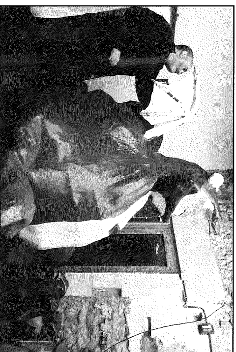
Els veïns del Llor estan ultimant aquestes dies el seu nou drac, l'Hug

Per altra banda, la Fira de Florejacs ja té enllestit el seu programa, que serà presentat públicament el proper dijous, 27 de març, a la seu del Consell Comarcal de la Segarra. Com a novetats, es presentarà l'Hug, el drac del poble del Llor, realitzat expressament