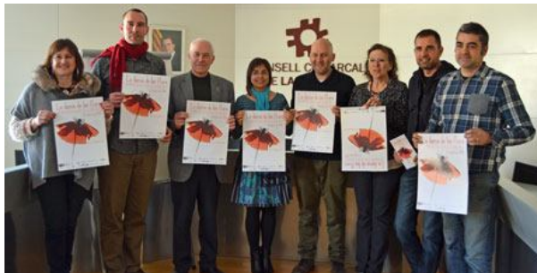
Foto de grup de l'acte de presentació de la fira.