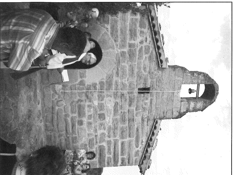
L'església del nucli ha pogut tornar a lluir la seva campana

GRANOLLERS. - El dissabte 26 de juliol, el nucli de Granollers de Segarra va celebrar la seva festa major. Unes vuitanta persones del municipi i dels pobles de les rodalies es van reunir en aquest petit indret de la Vall del Llobregós per celebrar la missa major, fer una lectura de poesies i participar del ball davant l'església de Sant Jaume.