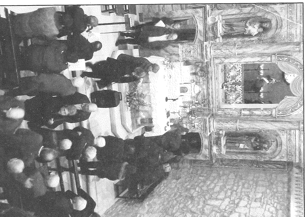
Els fidels van venerar la imatge de la seva patrona

L'endemà hi hagué la romeria fins a l'ermita i alla, la missa major, on es van cantar els goigs en honor a la Mare de Déu de Santesmasses. Les danses dels Bastoners de Sedó, el vermut popular i un espectacle musical a càrrec de Grepp Teatre van cloure les activitats d'aquesta nova edició de la festa major d'hivern de Sedó.