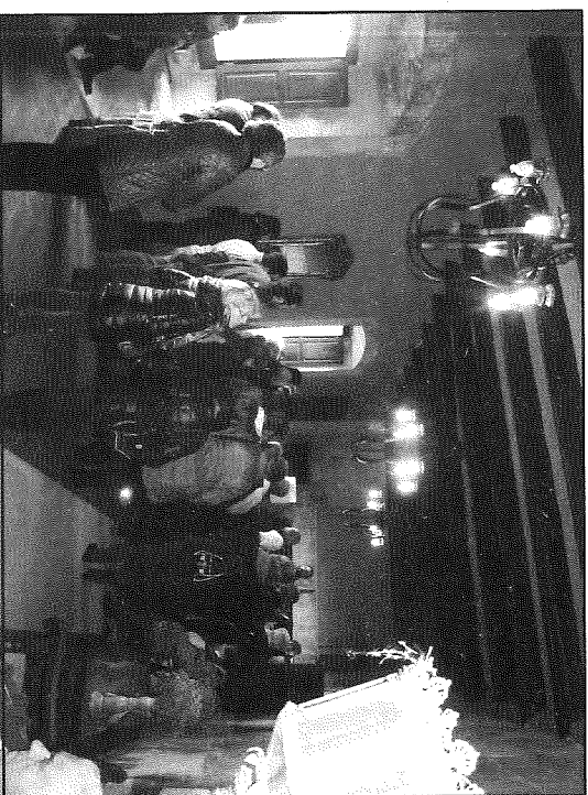
Els visitants vallesencs, durant el seu pas pel Castell de les Stiges