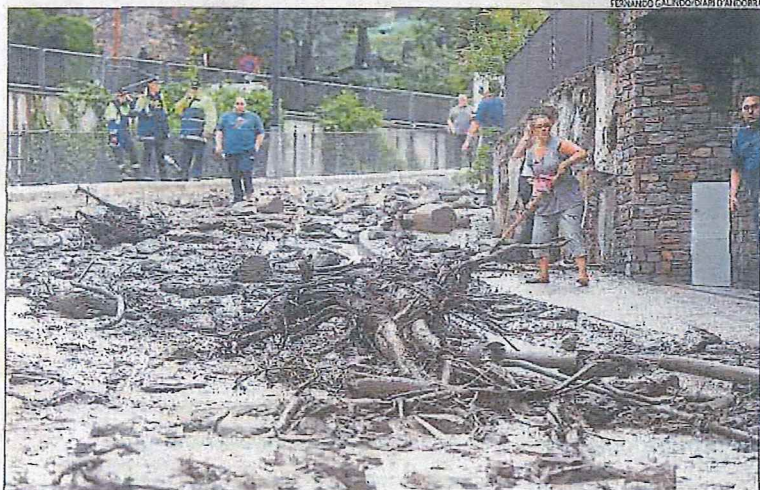
Un carrer de Sant Julià de Lòria, ahir a la tarda després de desbordar-se el riu Aixirivall.