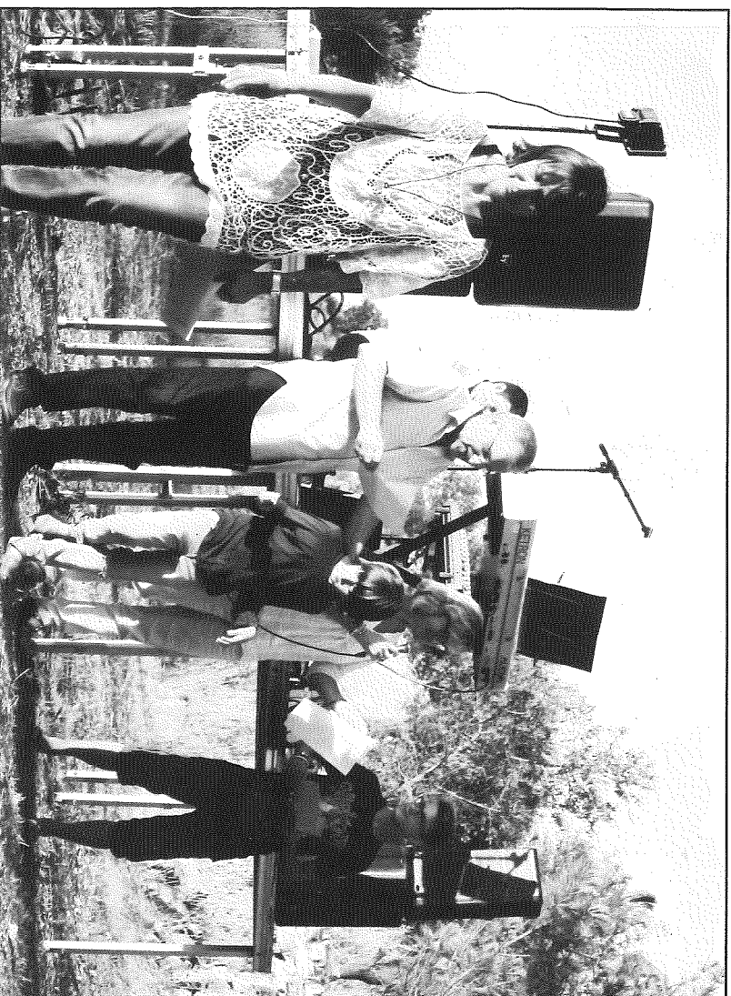
Un moment de la lectura poètica que van fer els assistents a la festa

enguany s'hi van tornar a reunir prop d'una setantena de persones, "moltes de les quals valoren el caràcter familiar i la delicadesa amb la que es prepara aquest esdeveniment", segons els organitzadors.