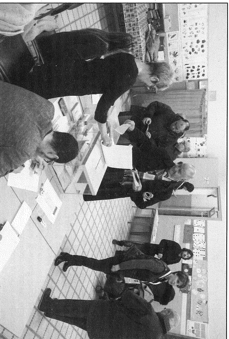
Taula electoral del col·ligi Jaume Balmes, a Cervera, on la participació ha crescut en 3 punts