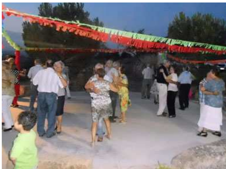
Una animada celebració.