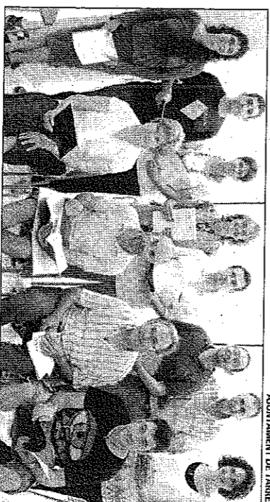
AJUNTAMENT DE TÀRREGA